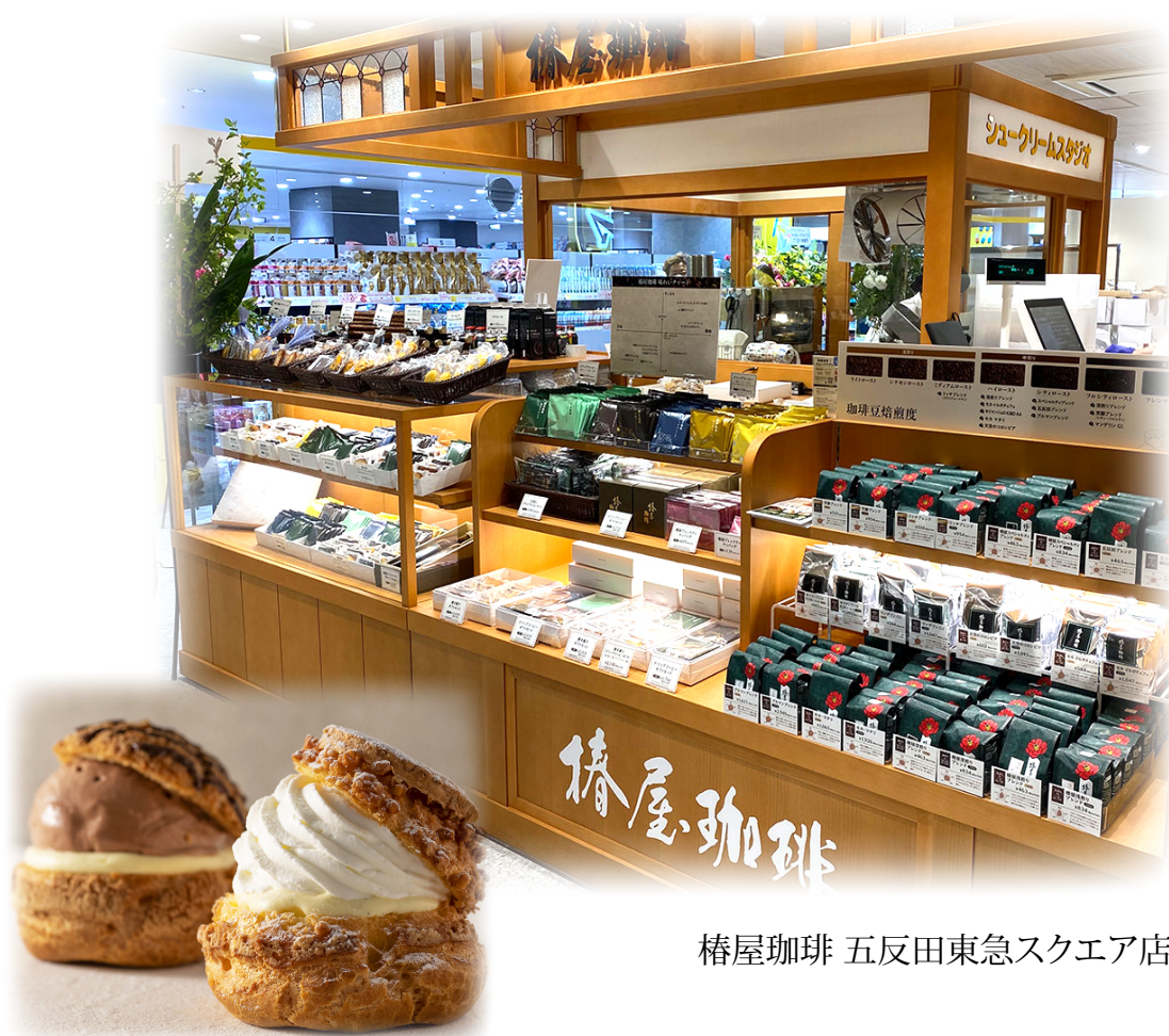
椿屋珈琲 五反田東急スクエア店