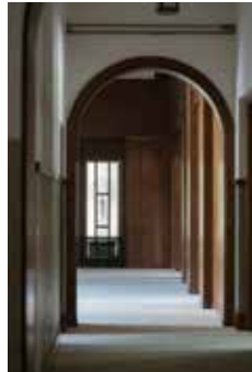
東京都庭園美術館本館 大広間

会期：2024 年 2 月 17 日（土）～ 5 月 12 日（日）／場所：東京都港区白金台 5-21-9／時間：10:00～18:00 2024 年 3 月 22 日（金）、23 日（土）、29 日（金）、30 日（土）は 夜間開館のため 20:00 まで開館（入館は 19:30 まで）／休館日：毎週月曜日（4/29、5/6 は開館、4/30、5/7 は休館）／一般 1,400 円、大学生（専修・各種専門学校含む）1,120 円、中学生・高校生と 65 歳以上 700 円 https://www.teien-art-museum.ne.jp ★お問い合わせ：050-5541-8600（ハローダイヤル）