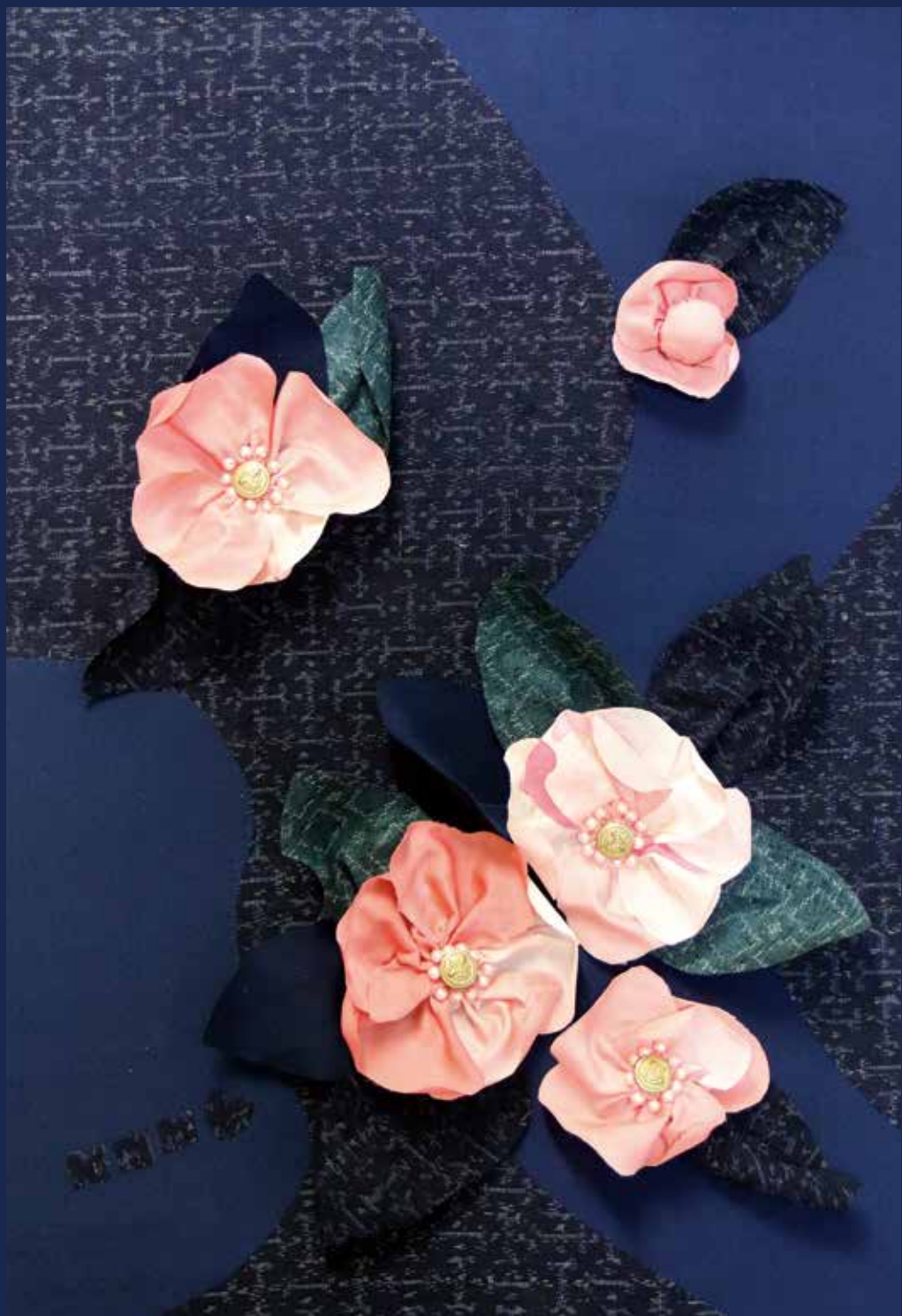
古布コラージュ「和色一呉須」 古布コラージュ・アーティスト 住川 信子