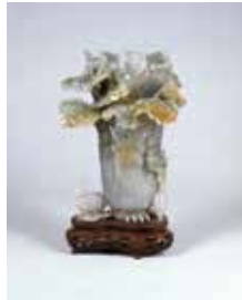
翡翠白菜形花瓶 清時代

当館の広範な中国美術コレクションから、北齊～唐時代の金銅仏とともに、明～清時代の漆器、陶磁器、玉器、絵画を展示いたします。他に類を見ない光源の世界が広がる松岡コレクションの中国美術。超越ともいえる工芸の粋と、長い歴史に育まれた文化の奥深さを堪能してください。