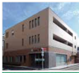
学芸大学に2店舗 徒歩0分と3分

TEL03-3710-1151 (大代表) FAX03-3713-0020 目黒区鷹番3-21-17 無休 平日10:00~18:00 (時短営業) 日・祝祭10:00~17:00 https://daimaru.es-ws.jp/