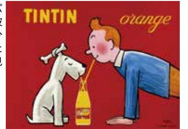
「Tintin Orange」 80x60 cm, 1980 年代 オフセット

会期：12 月 23 日（土）～ 2024 年 1 月 8 日（月・祝） 場所：Bunkamura Gallery 8/（渋谷ヒカリエ 8F） 東京都渋谷区渋谷 2-21-1／時間：11:00～20:00 ※年末年始の営業時間 1/1、1/2 休館 12/31 は 18:00 迄 https://www.bunkamura.co.jp/gallery8/ ★お問い合わせ：Bunkamura Gallery 8/ 03-3477-9174