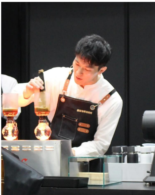
2025年 ジャパンサイフォニストチャンピオンシップ 優勝