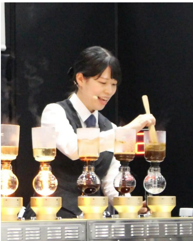
2025年 ワールドサイフォニストチャンピオンシップ 第5位