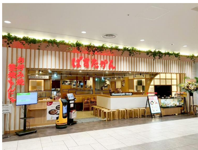
ばすたかん池袋サンシャインシティアルパ店